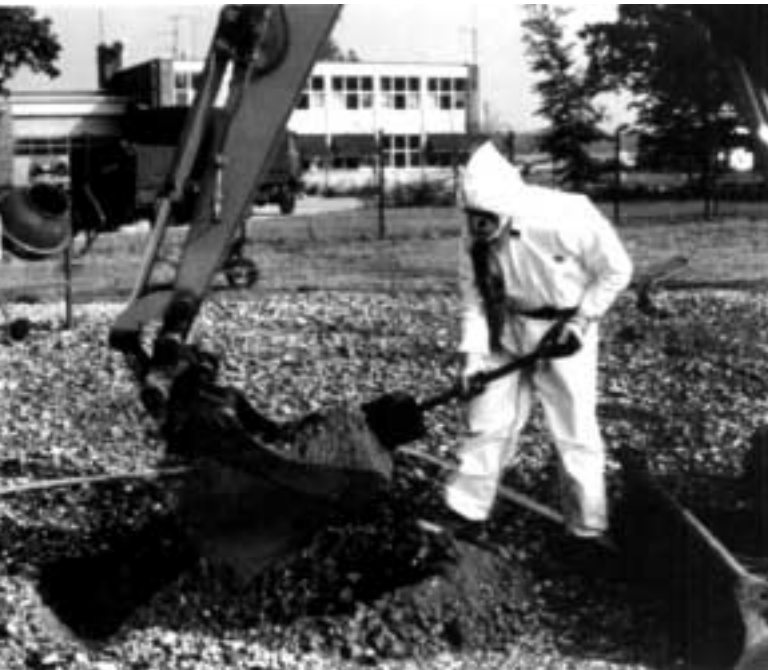
Monstername bij milieuonderzoek in het kader van een rechtszaak: statistiek speelt hierin een grote rol.

Bayesiaanse benadering is dat dergelijke manoeuvres overbodig zijn. Het bewijsmateriaal E is dat LdB betrokken was bij een x -tal incidenten, en de LR kan gewoon worden uitgerekend zonder dit te vervangen door tenminste een x -tal. Wanneer wij voor het selectie-effect zouden corrigeren door de hypothese H_p te vervangen door bijvoorbeeld H'_p ; er is een verband tussen de momenten dat één van de 27 verpleegsters op de afdeling dienst had en het aantal incidenten, dan zou de teller van de LR ongeveer een factor 27 kleiner worden, maar de a priori kansverhouding H_p:H_d ongeveer een factor 27 groter. De lagere bewijswaarde als we H'_p kiezen in plaats van H_p wordt dus weer gecompenseerd door een grotere a priori kansverhouding, zodat de a posteriori kansverhouding hetzelfde blijft. Ook wanneer we niet op de afdeling willen focussen maar op een nog grotere groep zal er een soortgelijk compensatie-effect optreden. De a priori kansverhouding corrigeert dus op een heel natuurlijke wijze voor het selectie-effect.